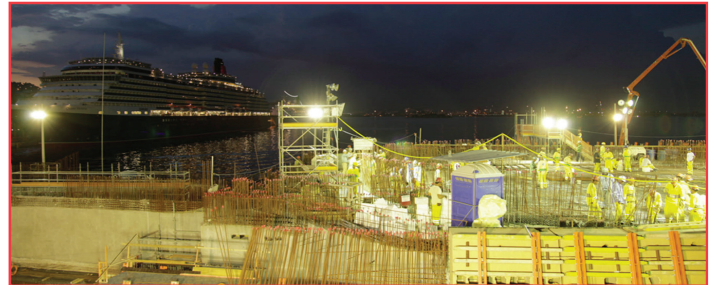
Ação de concretagem da laje do auditório levou 13 horas

A Concessionária Porto Novo executou, no dia 24 de janeiro, a maior etapa de concretagem do Museu do Amanhã. Para fazer a laje do auditório, estrutura de forma elíptica localizada na parte central do píer, foram necessários 360 m 3 de concreto estrutural fornecidos em 59 viagens de caminhões betoneiras. Com a