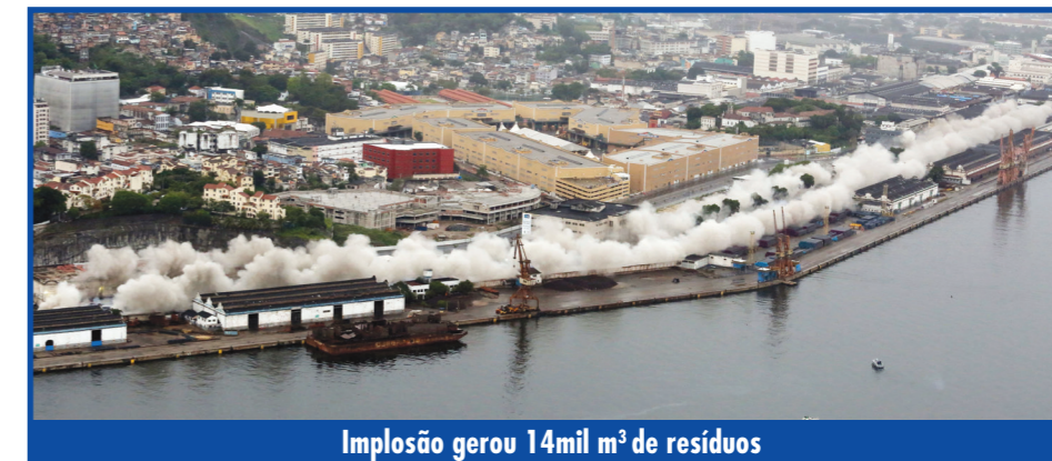
Implosão gerou 14mil m³ de resíduos

O ano de 2014 já começa com um novo desafio: o desmonte do segundo trecho da Perimetral, com 1.689 metros, entre a Praça Mauá e o III Comar.