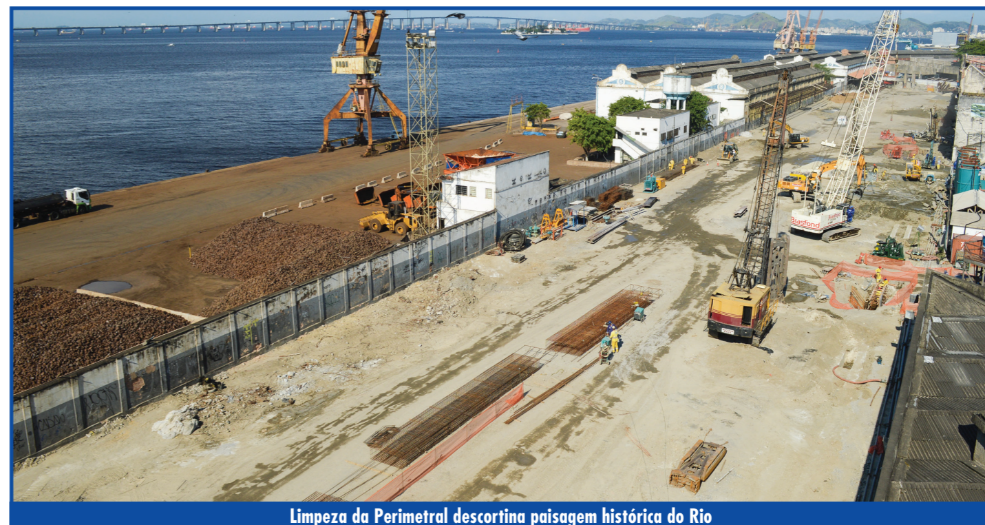
Limpeza da Perimetral descortina paisagem histórica do Rio

A linda vista da Baía de Guanabara, há tempos escondida pelas centenas de pilas e pistas do Elevado da Perimetral, já foi devolvida aos moradores e trabalhadores dos prédios localizados na Avenida Rodrigues Alves. Quem mora ou trabalha no trecho entre a Avenida Professor Pereira Reis e a Rua Silvino Montenegro, agora, pode contemplar uma parte da beleza natural do Rio de Janeiro, passar os olhos pelos transatlânticos aportados no cais e ver de longe a Ponte Rio-Niterói, uma das construções mais incríveis da cidade.